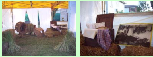
Mostra "lavoro delle mondine"